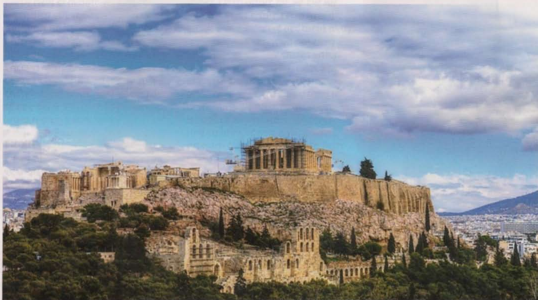
אקרופוליס, העיר העליונה ביוון העתיקה

מהחלום, תמונה של ירושלים. הייתי בשוק, מכיוון שעד אז לא היה לי שום קשר לישראל, אפילו שאני יהודי."